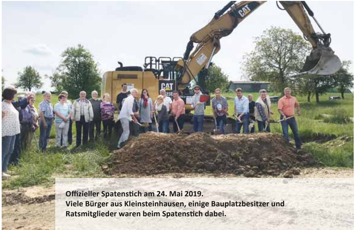
Offizieller Spatenstich am 24. Mai 2019. Viele Bürger aus Kleinsteinhausen, einige Bauplatzbesitzer und Ratsmitglieder waren beim Spatenstich dabei.

Die Ortsgemeinde Kleinsteinhausen hat ein Baugebiet mit 9 Bauplätzen ausgewiesen. Mit dem Unternehmen Berthold Staab aus Schmitzhausen steht ein Erschließungsträger an der Seite der Gemeinde. Ein Bauplatz ist noch frei für 92,50€/qm. Aktuell werden die Erschließungsarbeiten durchgeführt. Die Verlegung der Wasserleitung und des Kanals sind bereits abgeschlossen. Im Moment werden die Verlegung der Stromleitungen und der Straßenbeleuchtung vorbereitet. Das Gebiet wird durch die Telekom mit Glasfaser angebunden, somit sind Bandbreiten bis zu 1 GBIT möglich.